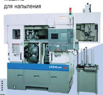
Машина для напыления