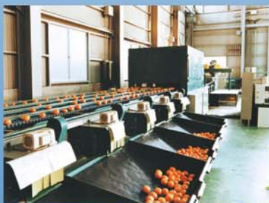
Оборудование для автоматической сортировки фруктов

Специалисты компании SMC готовы предоставить Вам любую дополнительную информацию по применению промышленной пневматики в Вашем производстве, и предложить решения, наилучшим образом подходящие для Ваших задач с экономической и технической точек зрения.