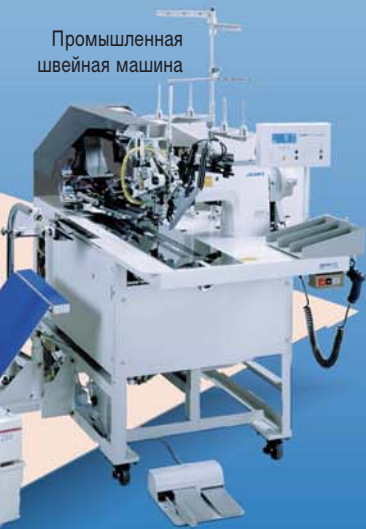
Промышленная швейная машина