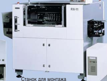
Станок для монтажа электронных компонентов