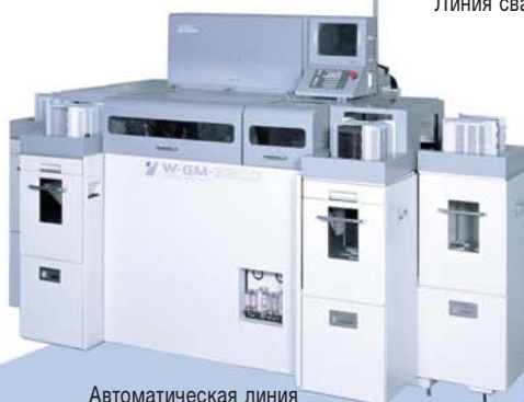
Автоматическая линия для производства компакт-дисков