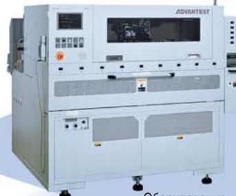
Оборудование для тестирования