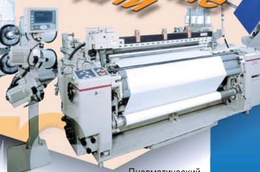
Пневматический ткацкий станок