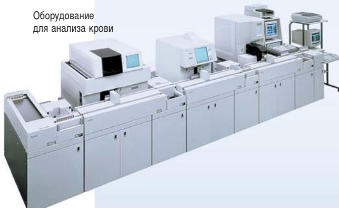
Оборудование для анализа крови