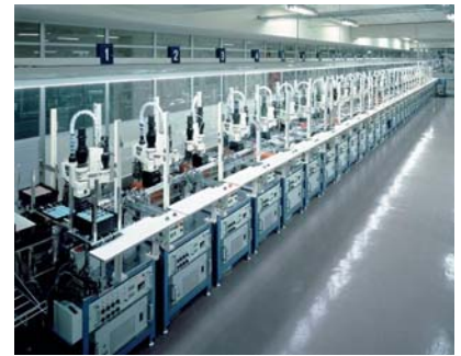
Линия по сборке часов

Пневматические компоненты производства SMC находят применение в самых разных отраслях промышленности.