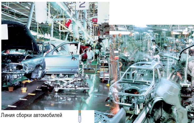
Линия сборки автомобилей