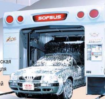
Автоматическая установка для мойки автомобилей