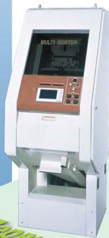
Автоматический сортировщик риса