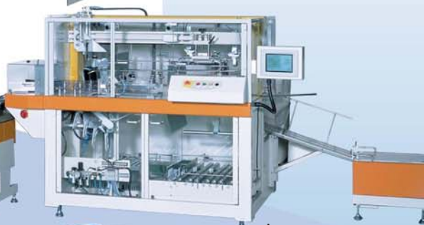
Автоматическая упаковочная машина

Обрабатывающая промышленность и машиностроение